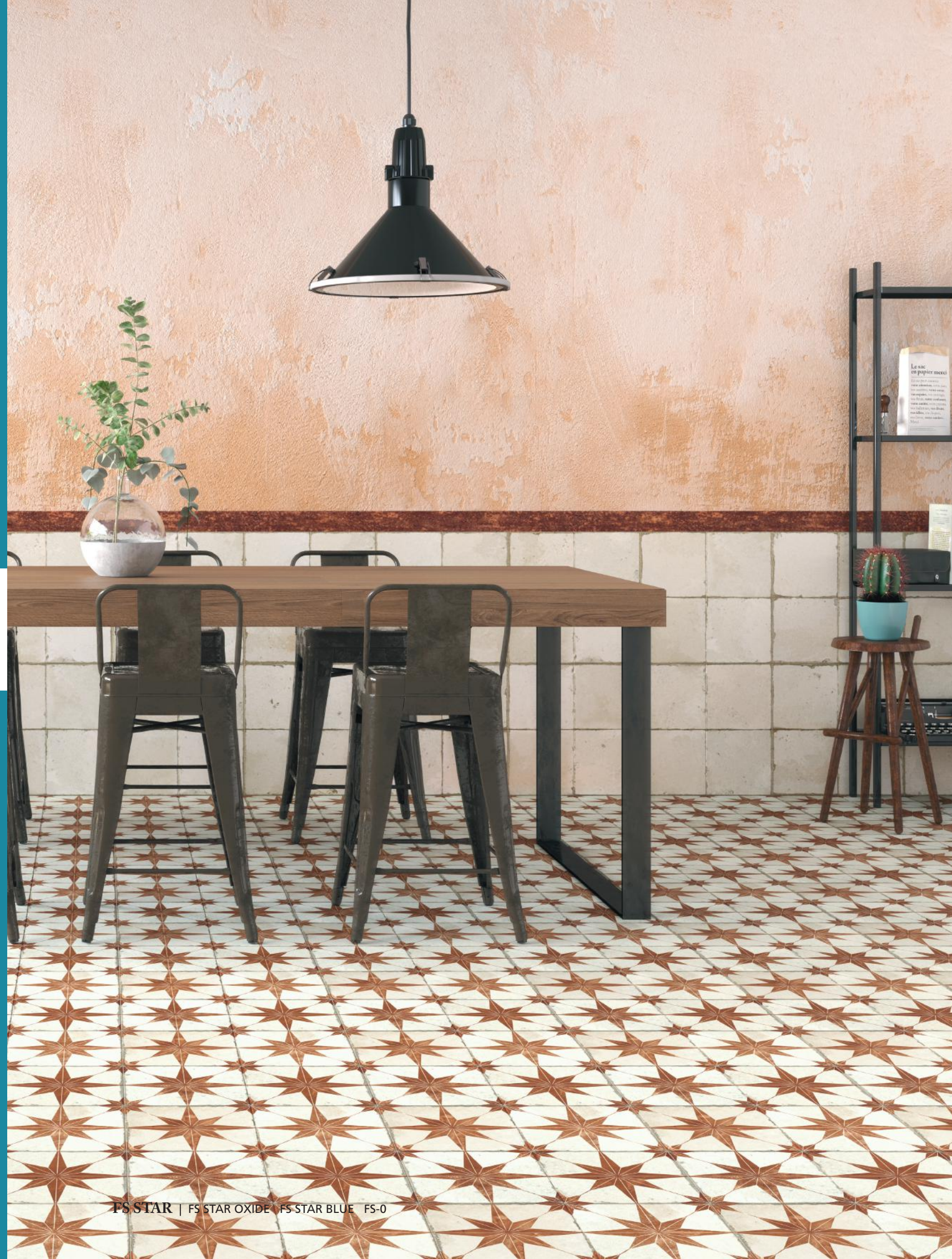
FS STAR Blue