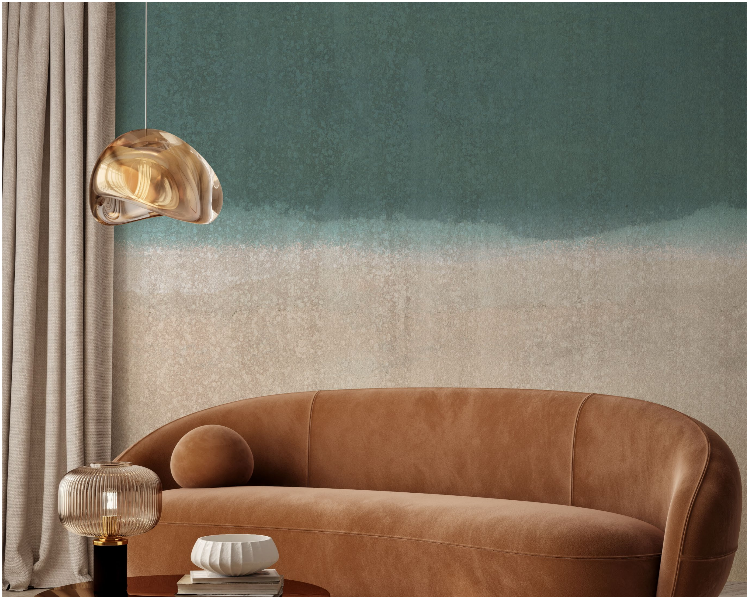
landscapes | FN0402