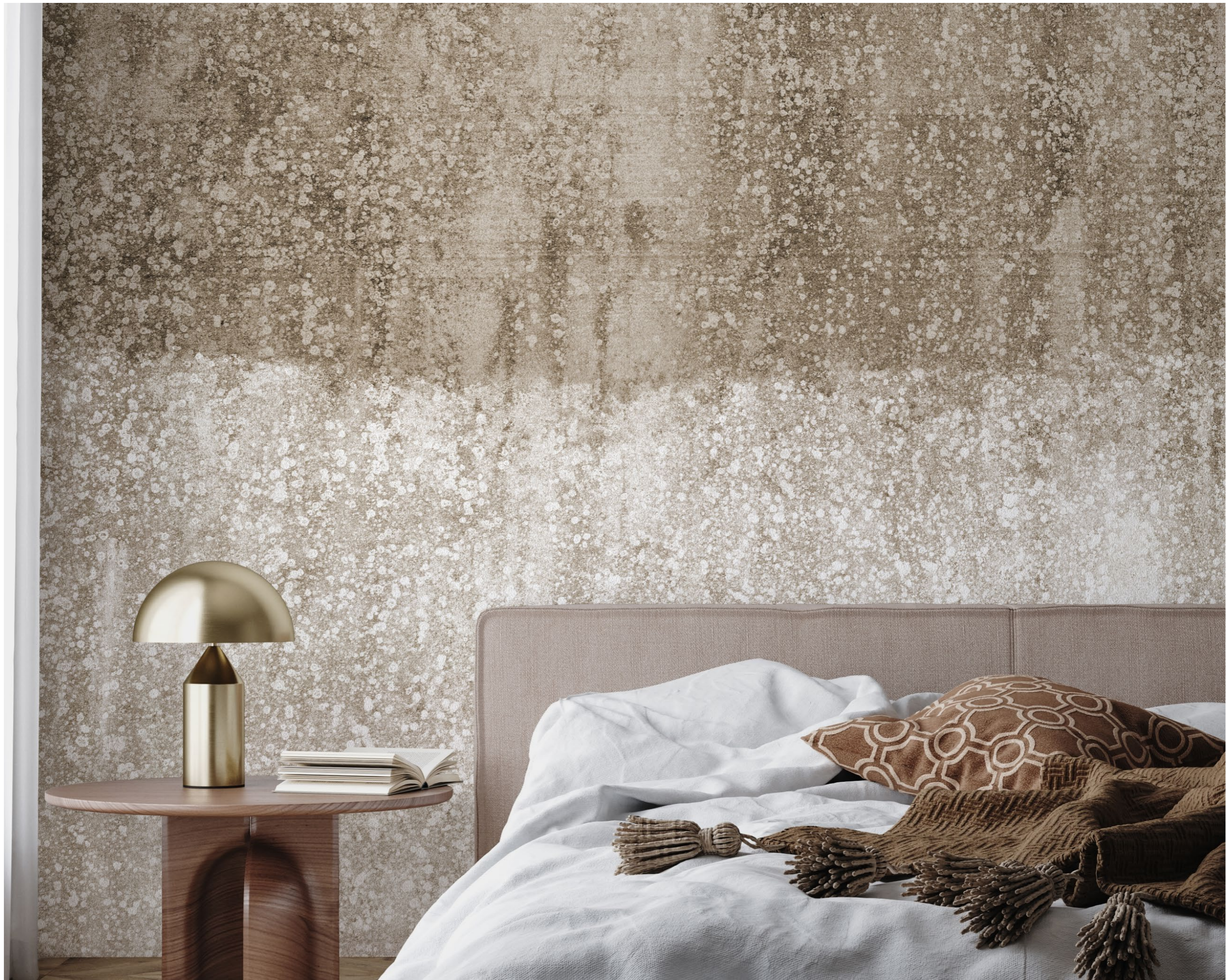
landscapes | FN0303