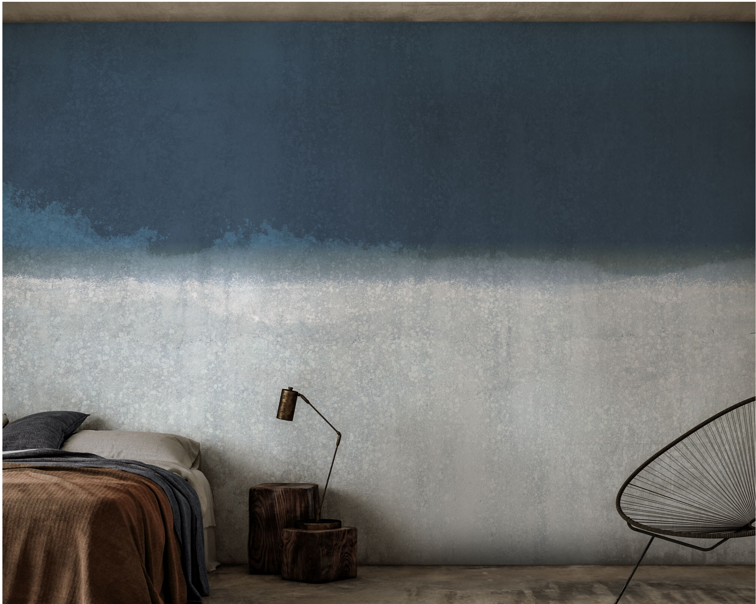
landscapes | FN0404