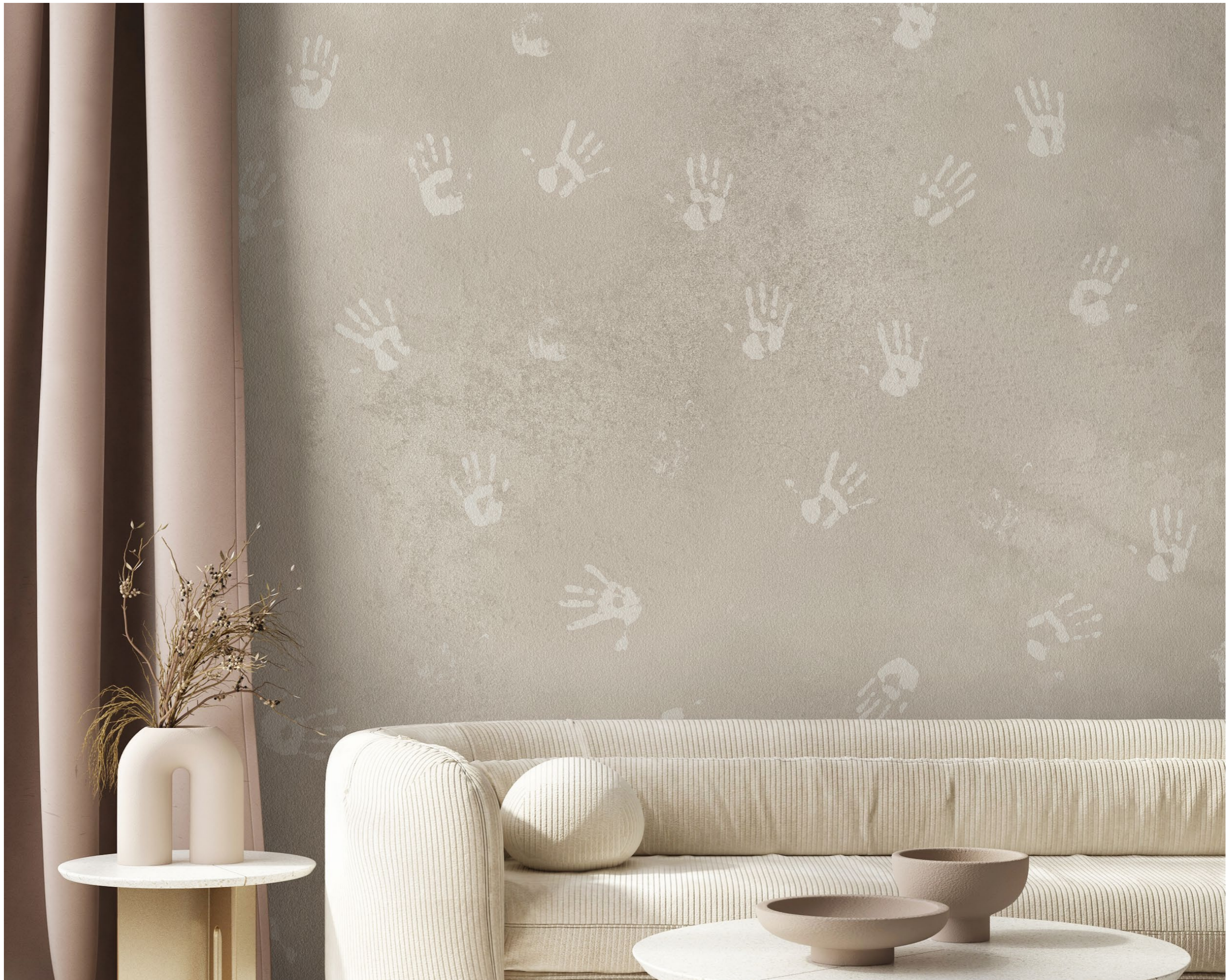
handprints | FN0201