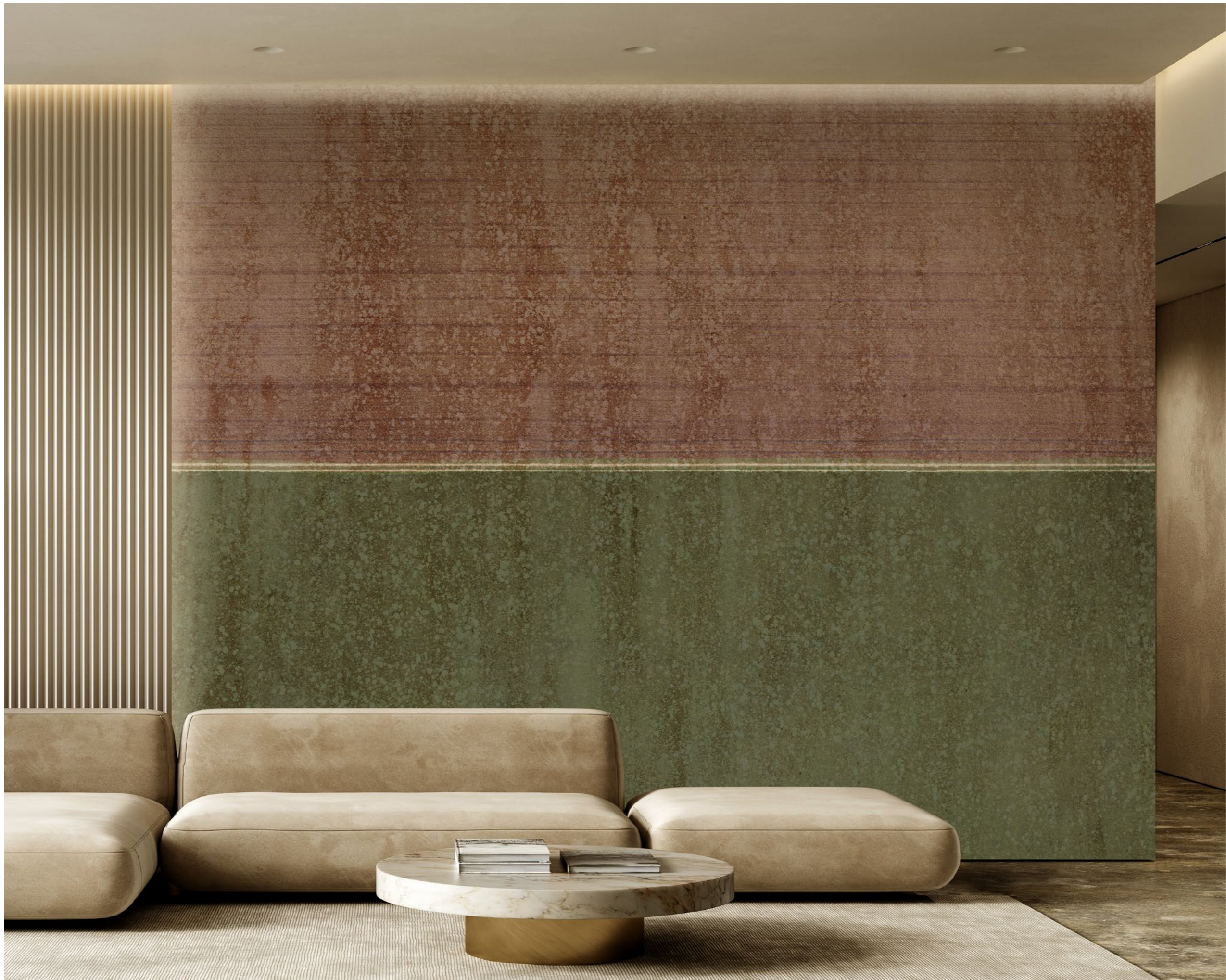
landscapes | FN0502