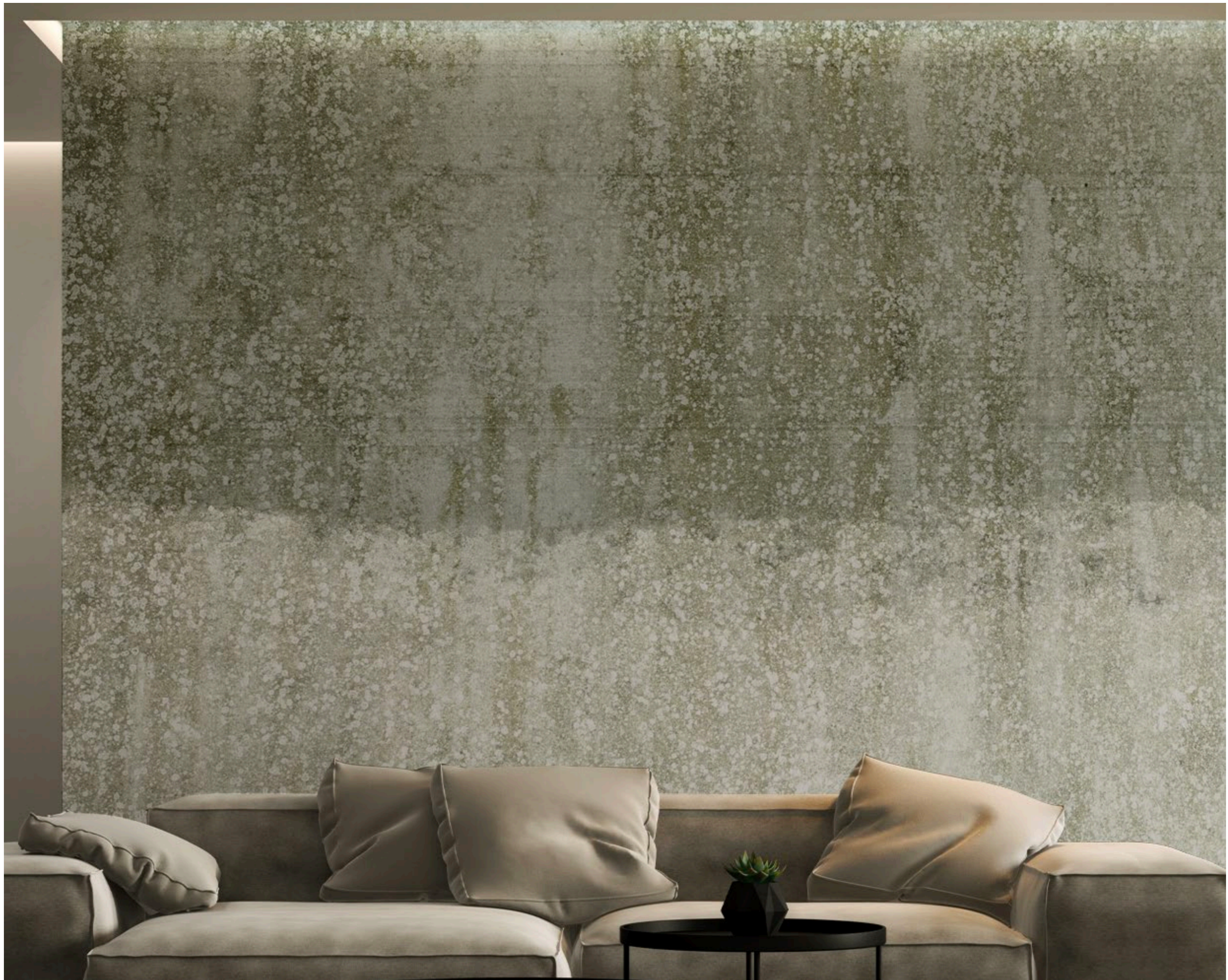
landscapes | FN0301