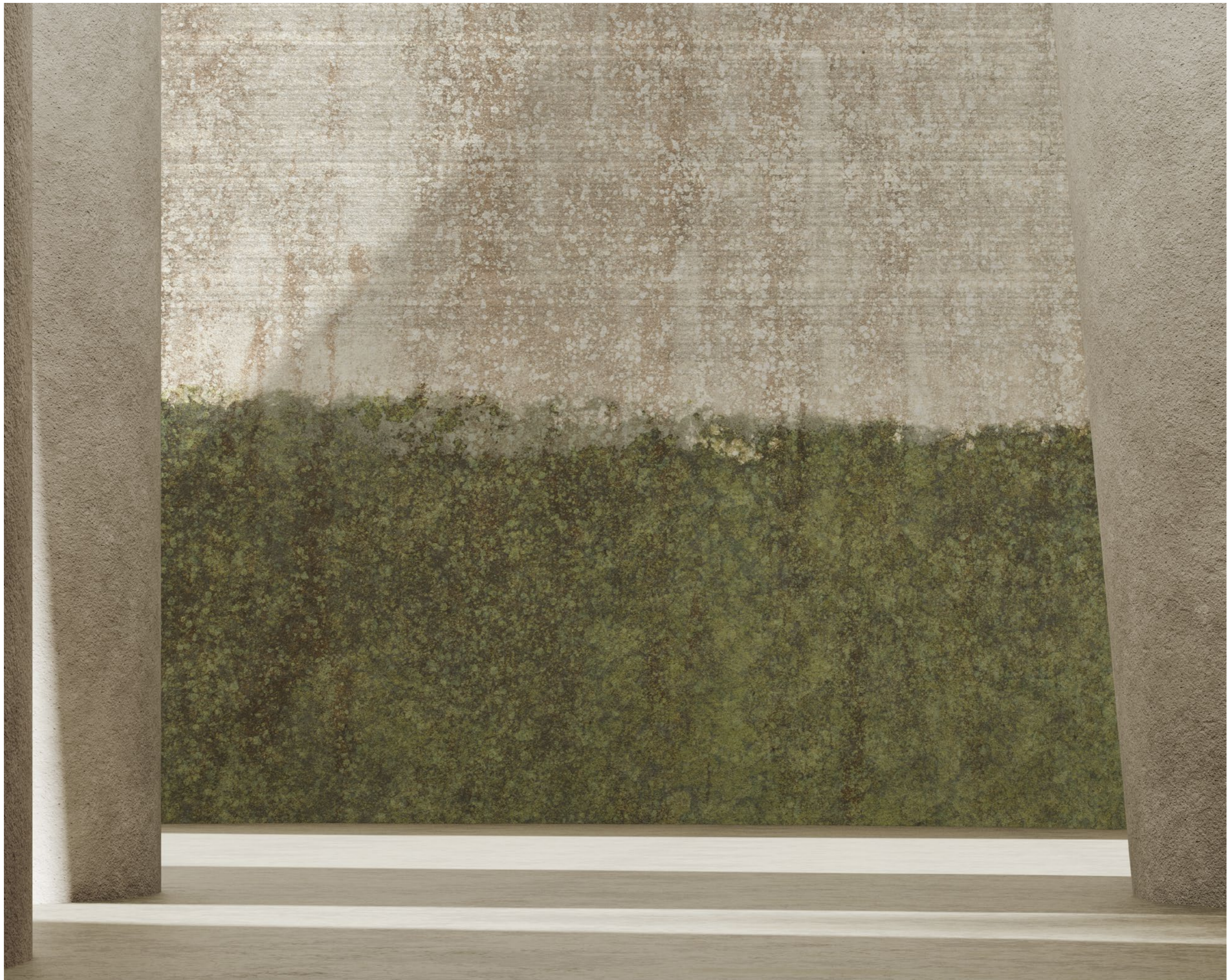
landscapes | FN0302