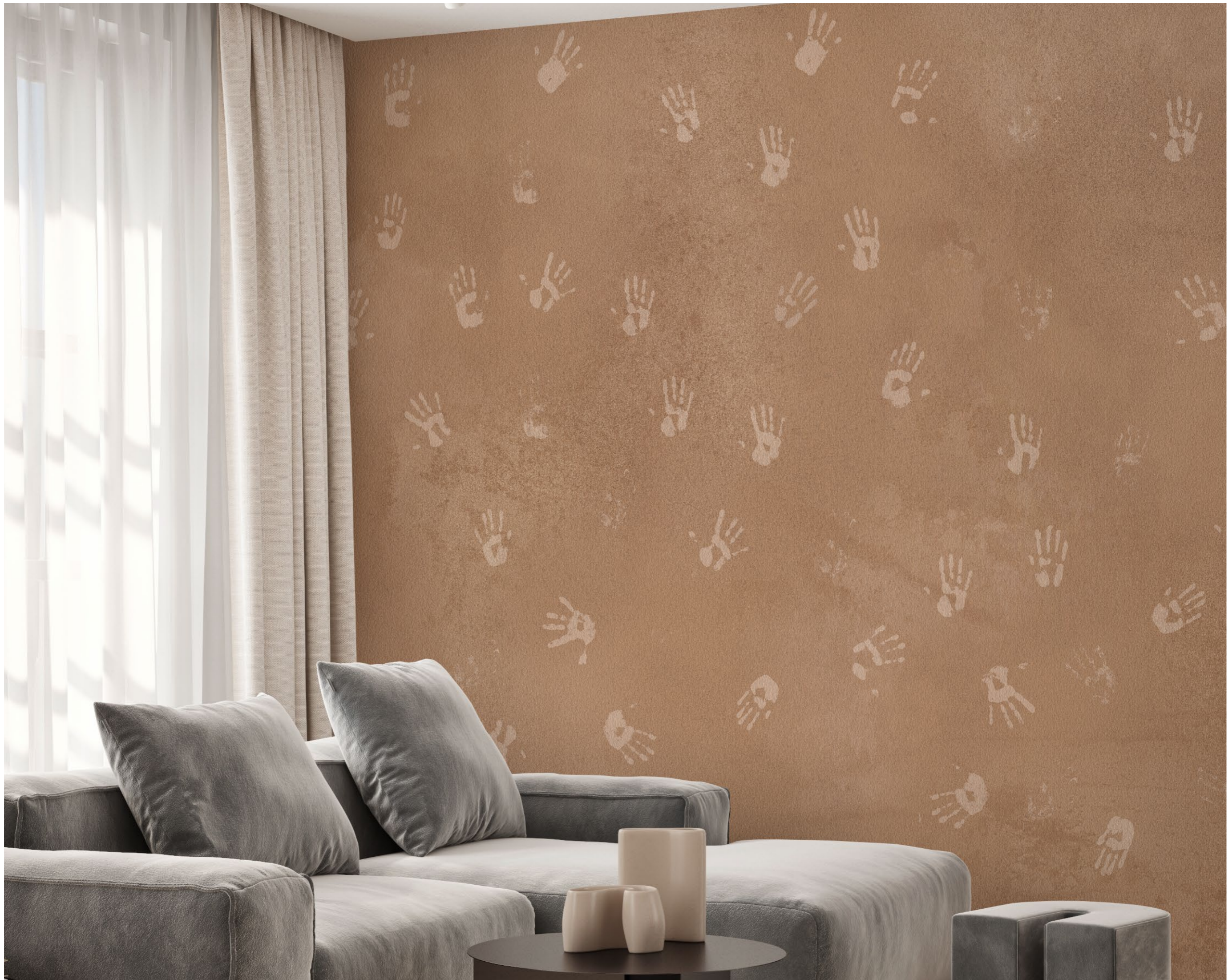
handprints | FN0208