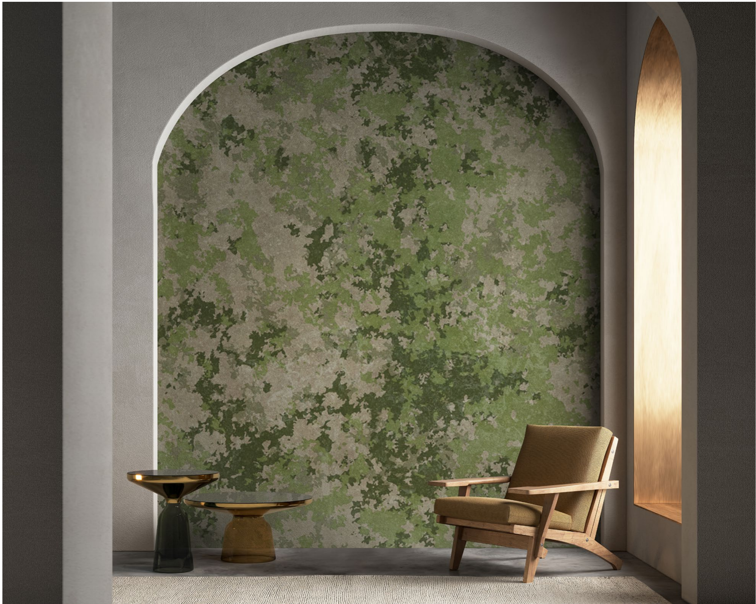
camouflage | FN0103