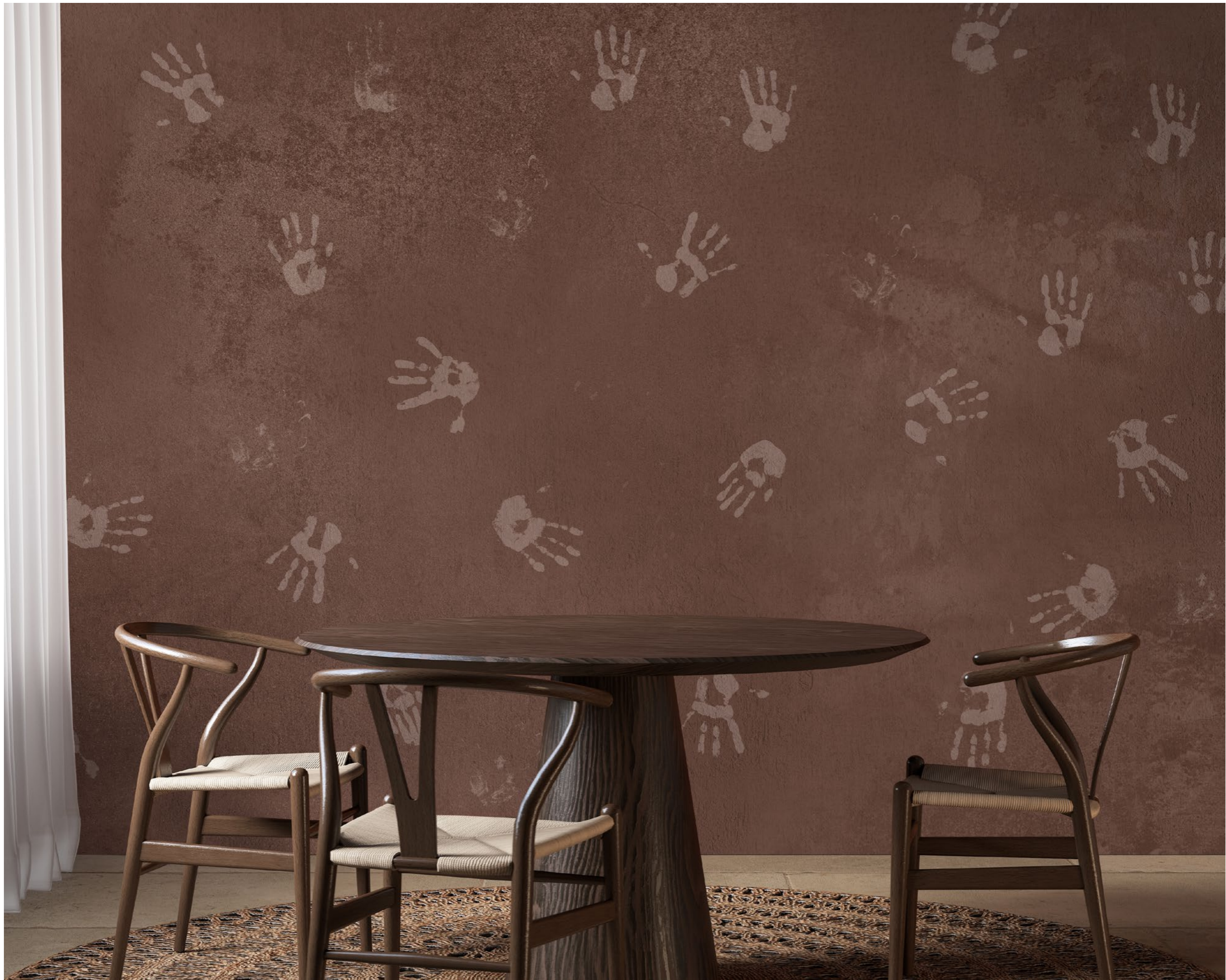
handprints | FN0206