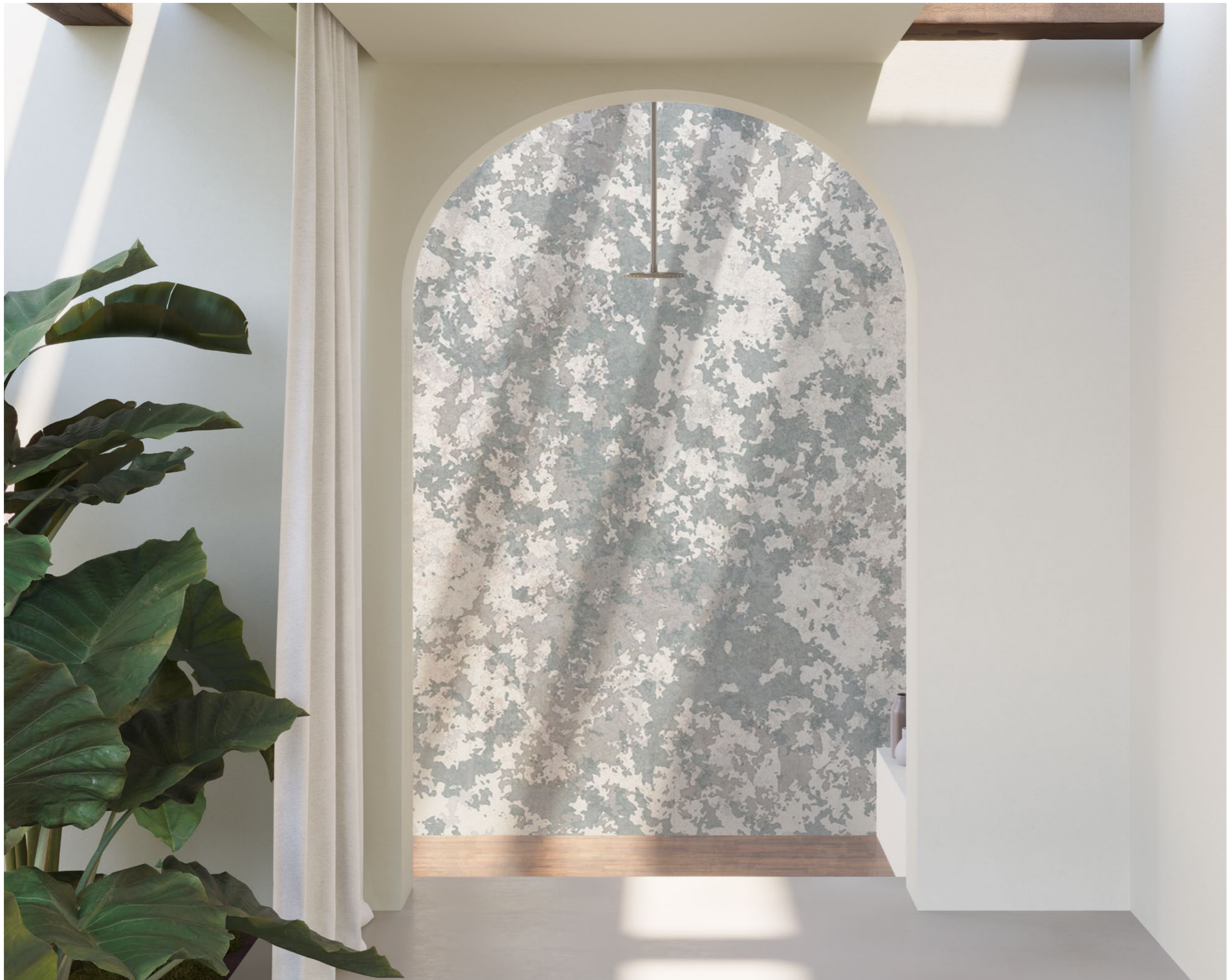
camouflage | FN0101