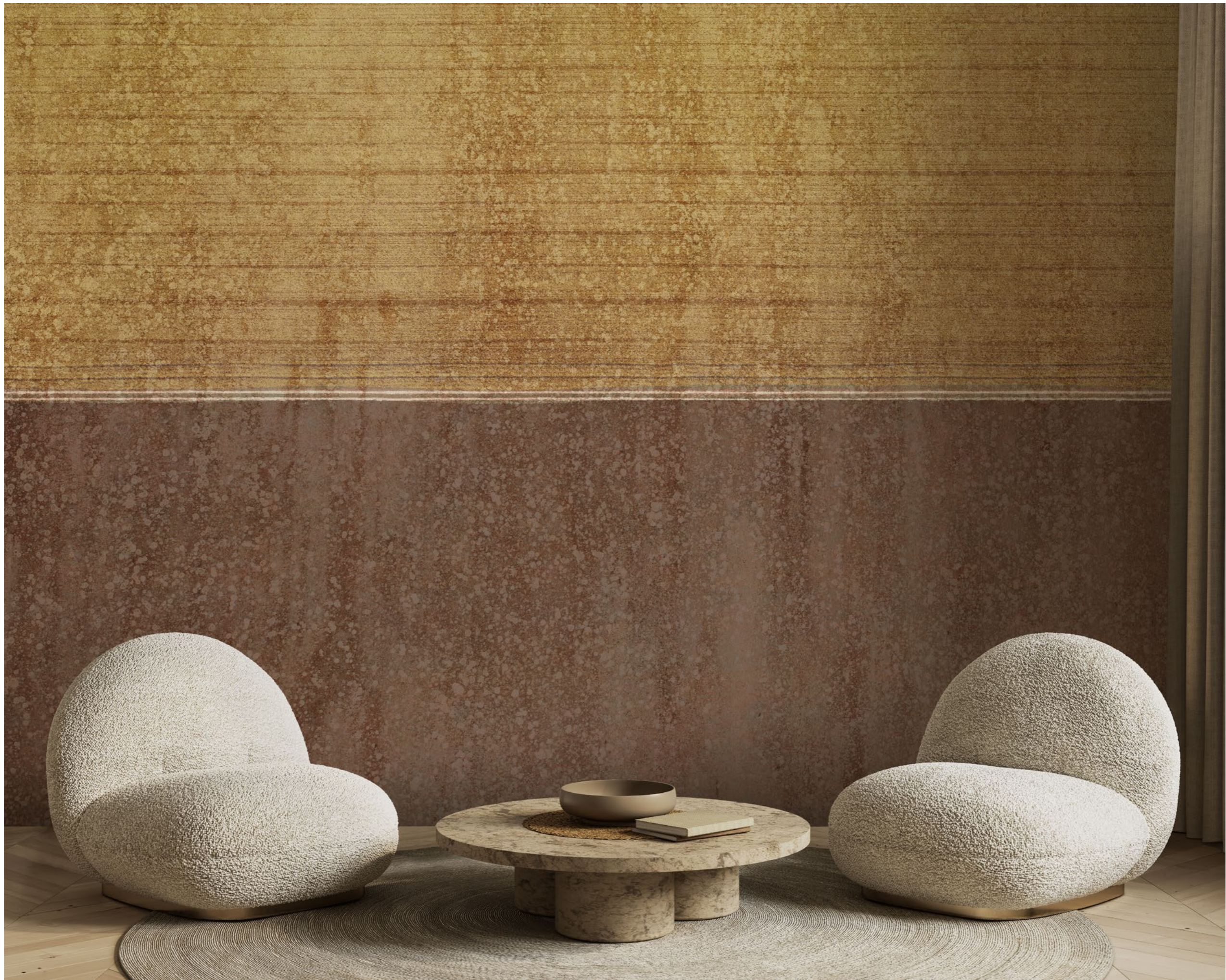
landscapes | FN0501