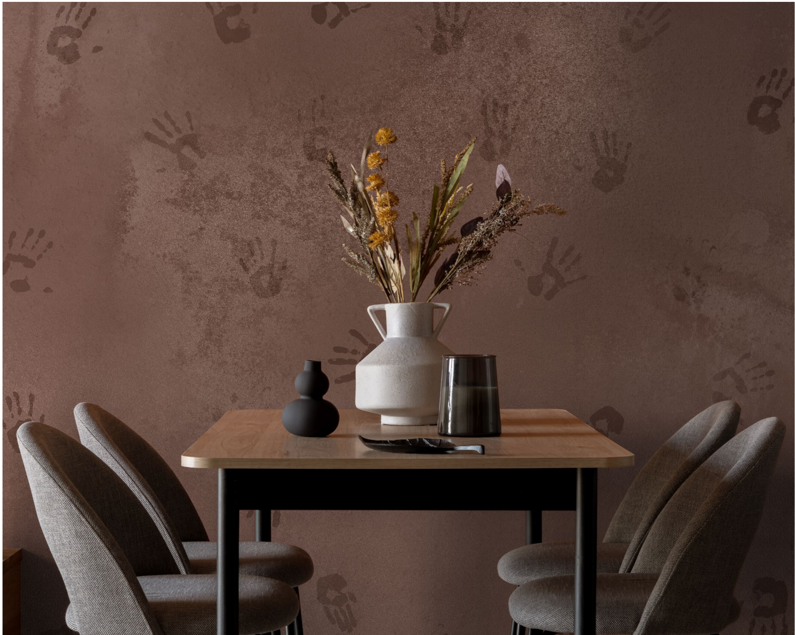
handprints | FN0207