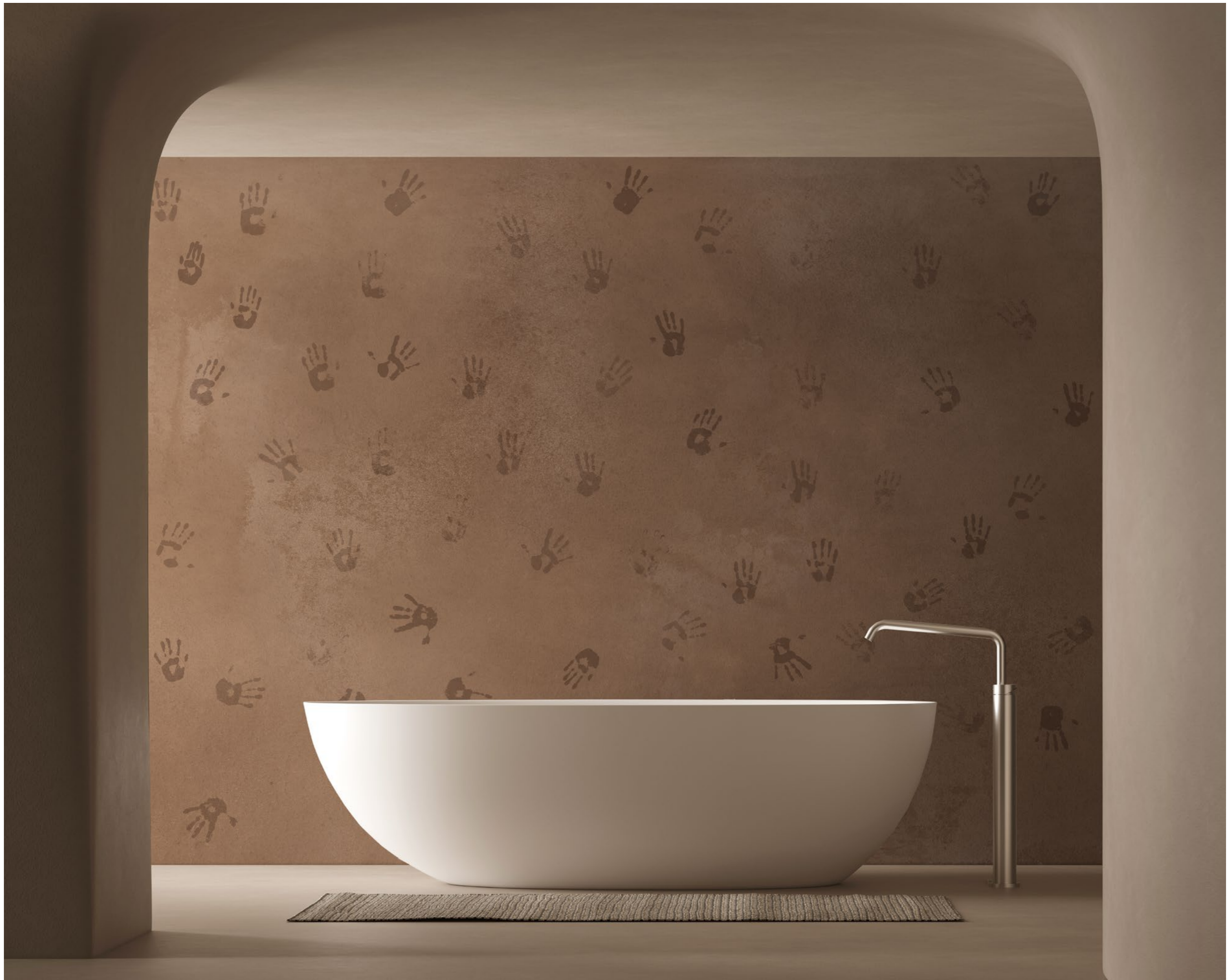
handprints | FN0209