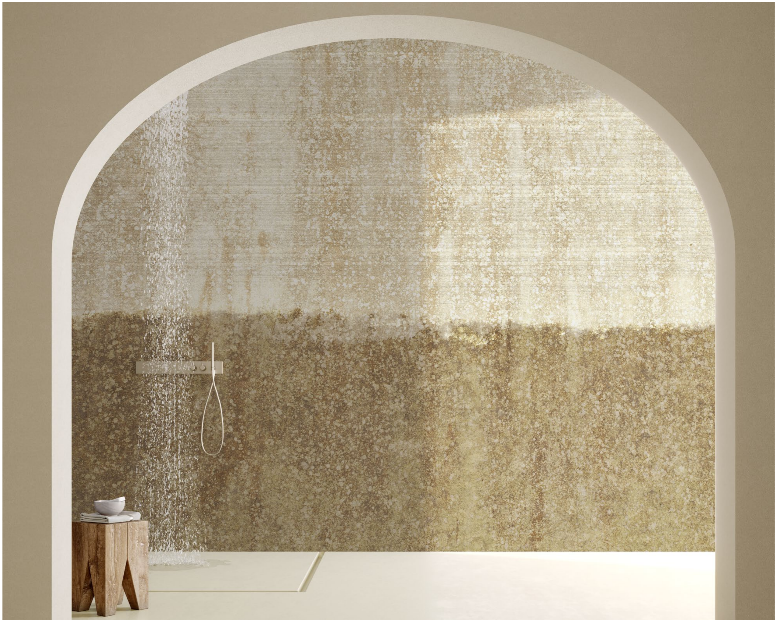
landscapes | FN0306