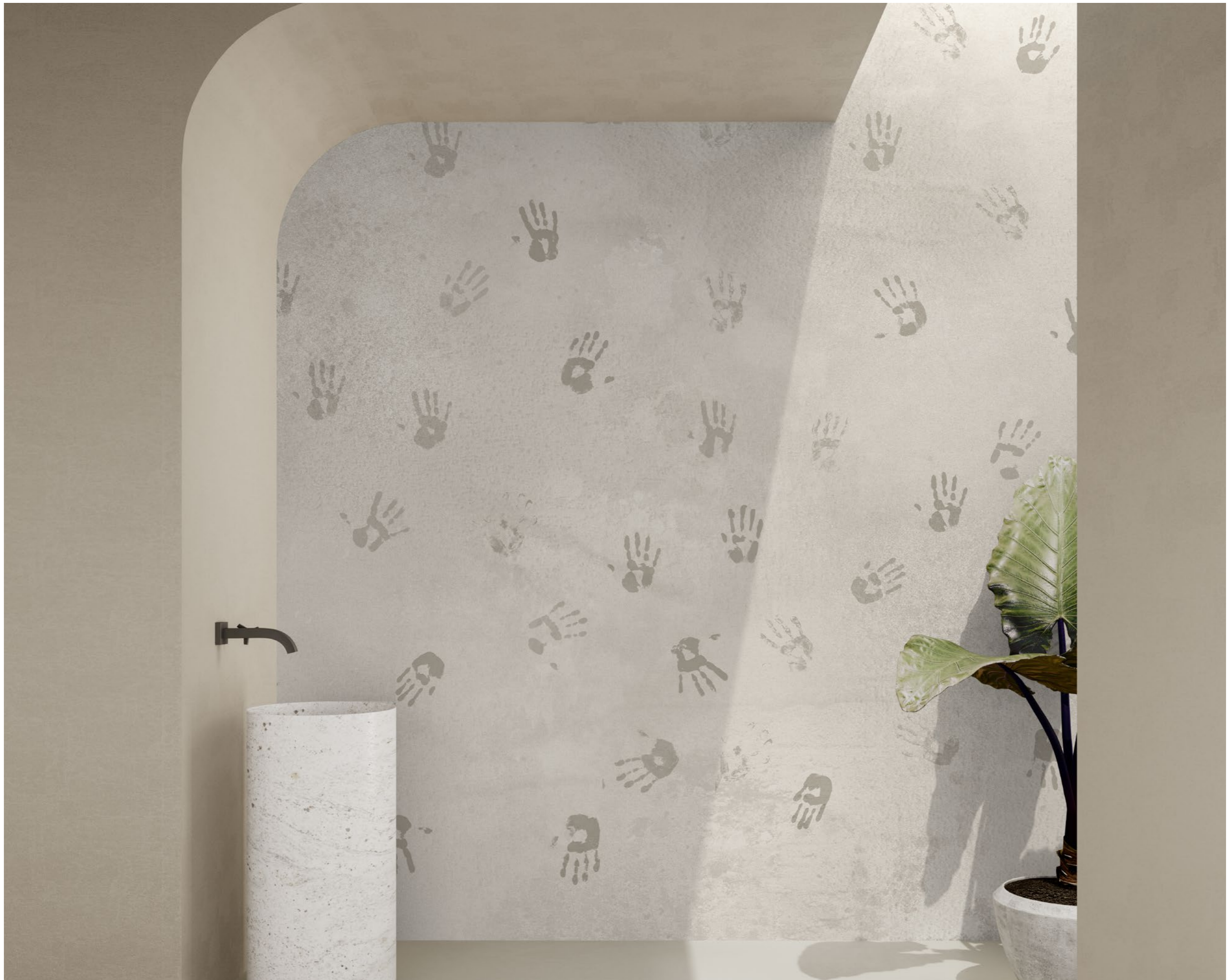
handprints | FN0202