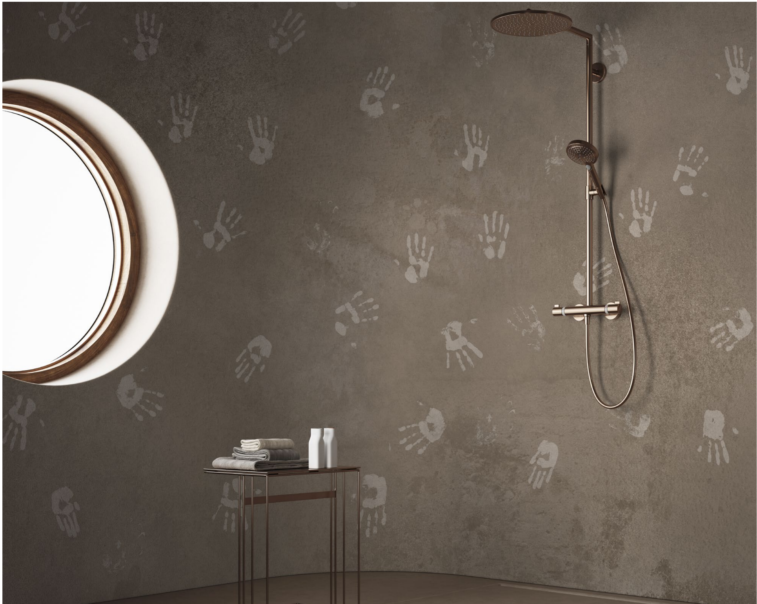
handprints | FN0204