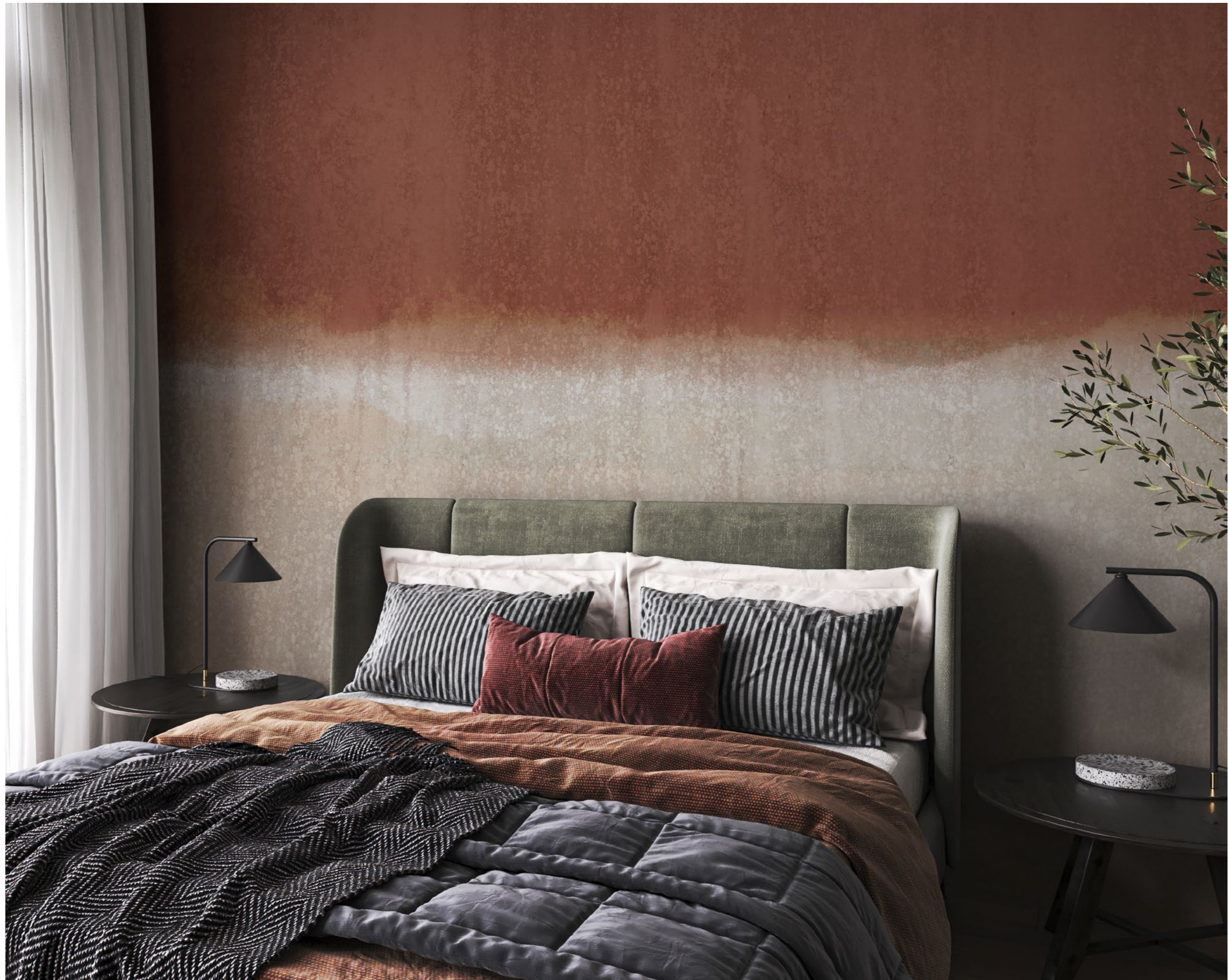
landscapes | FN0403