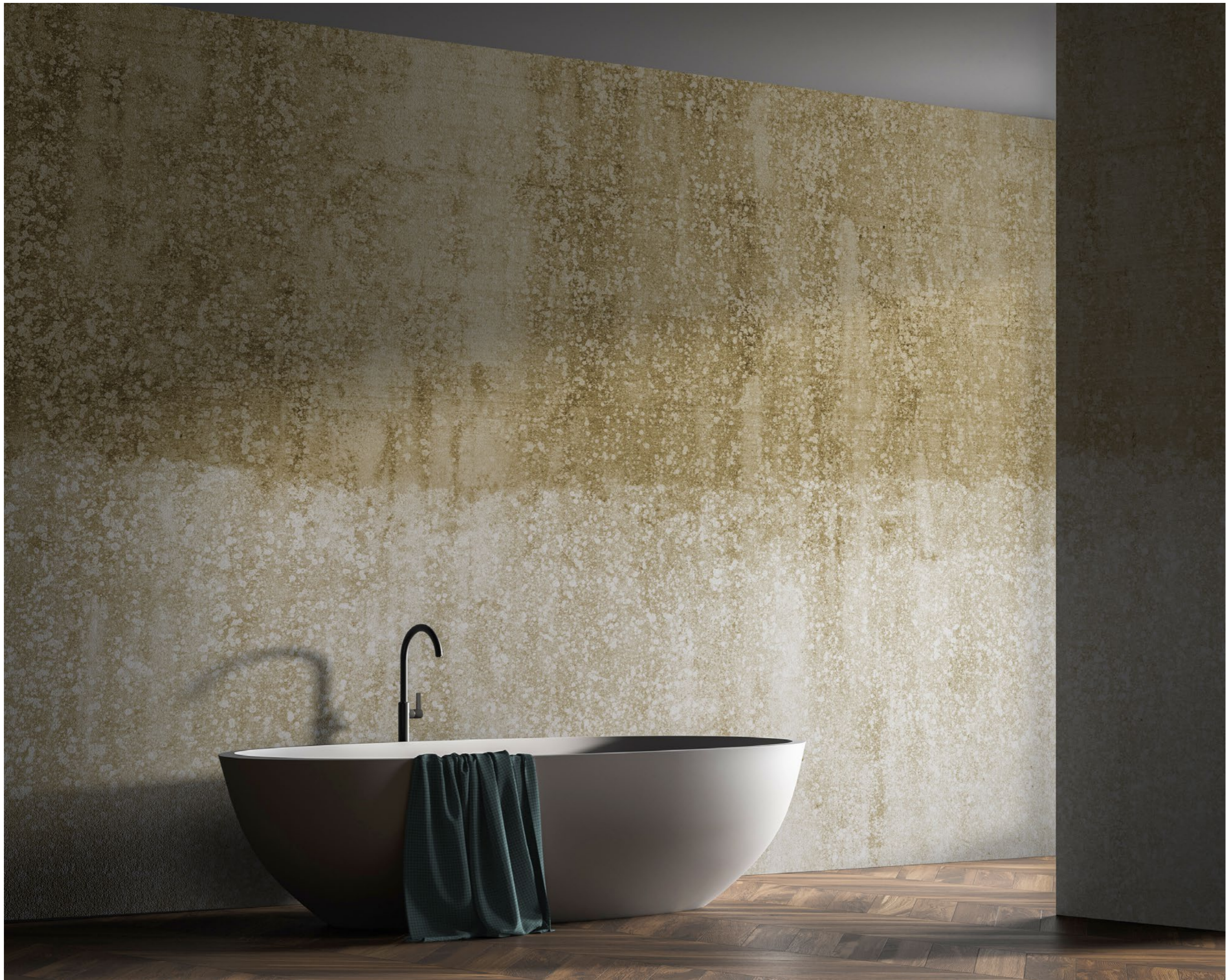
landscapes | FN0305