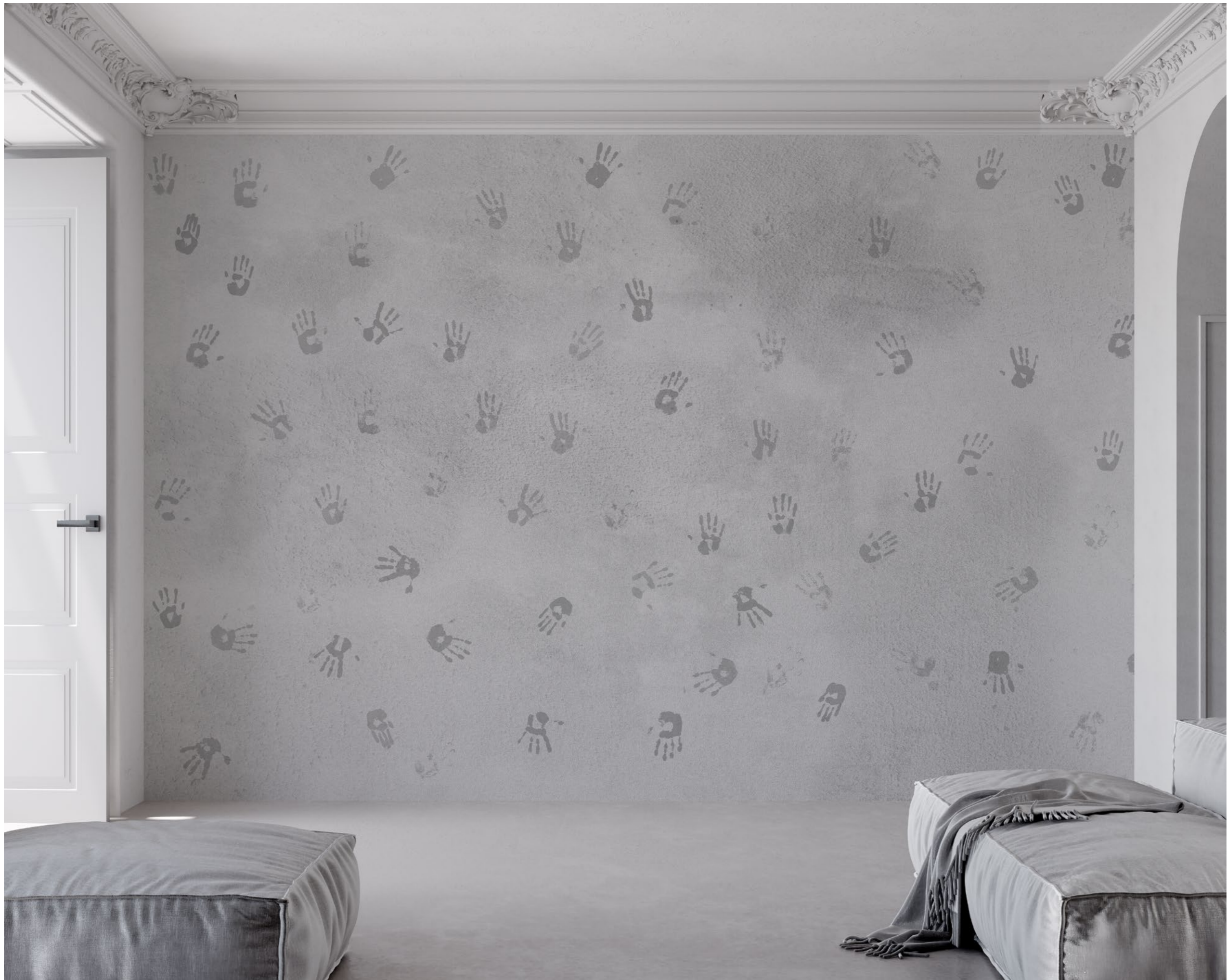
handprints | FN0203