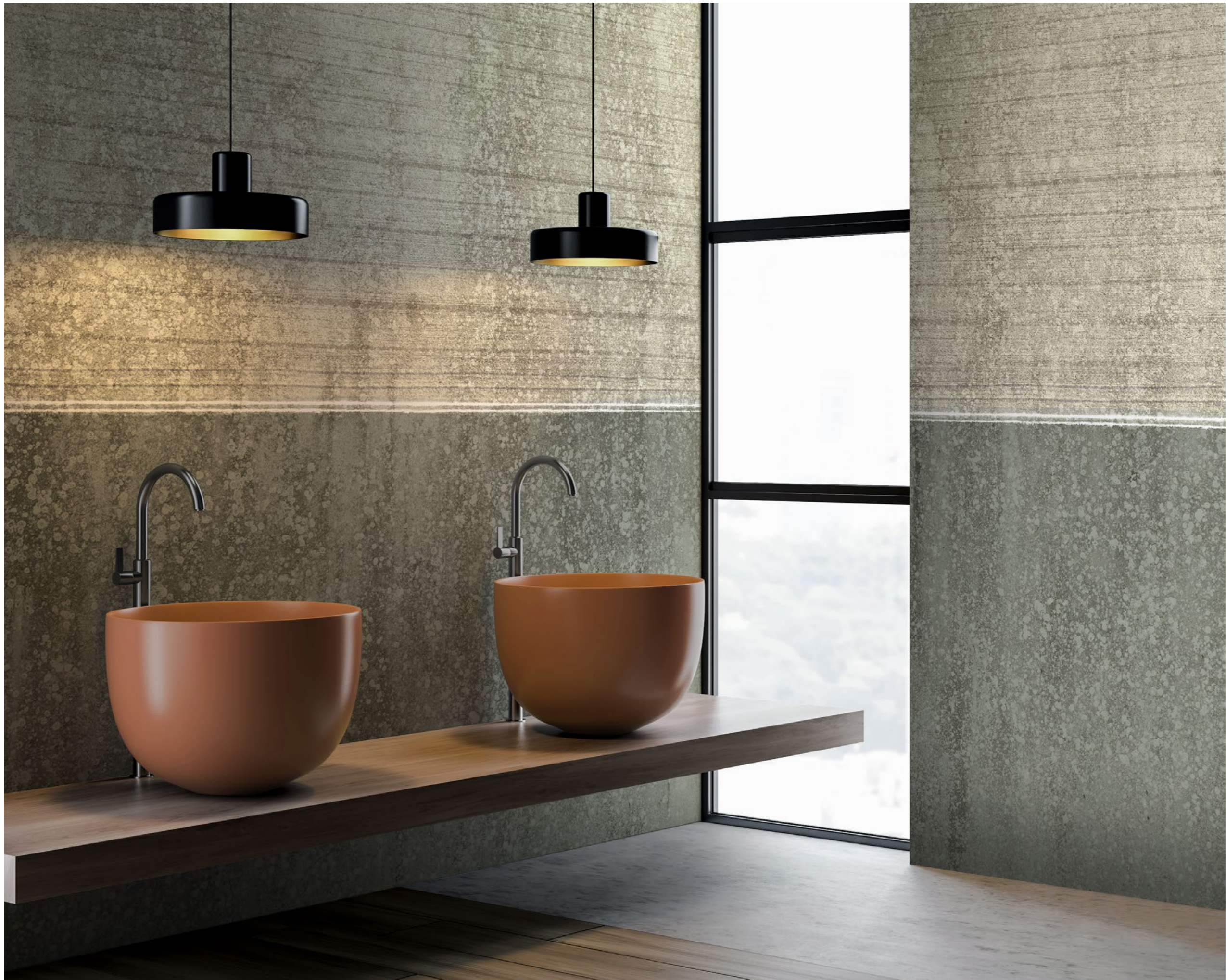
landscapes | FN0504