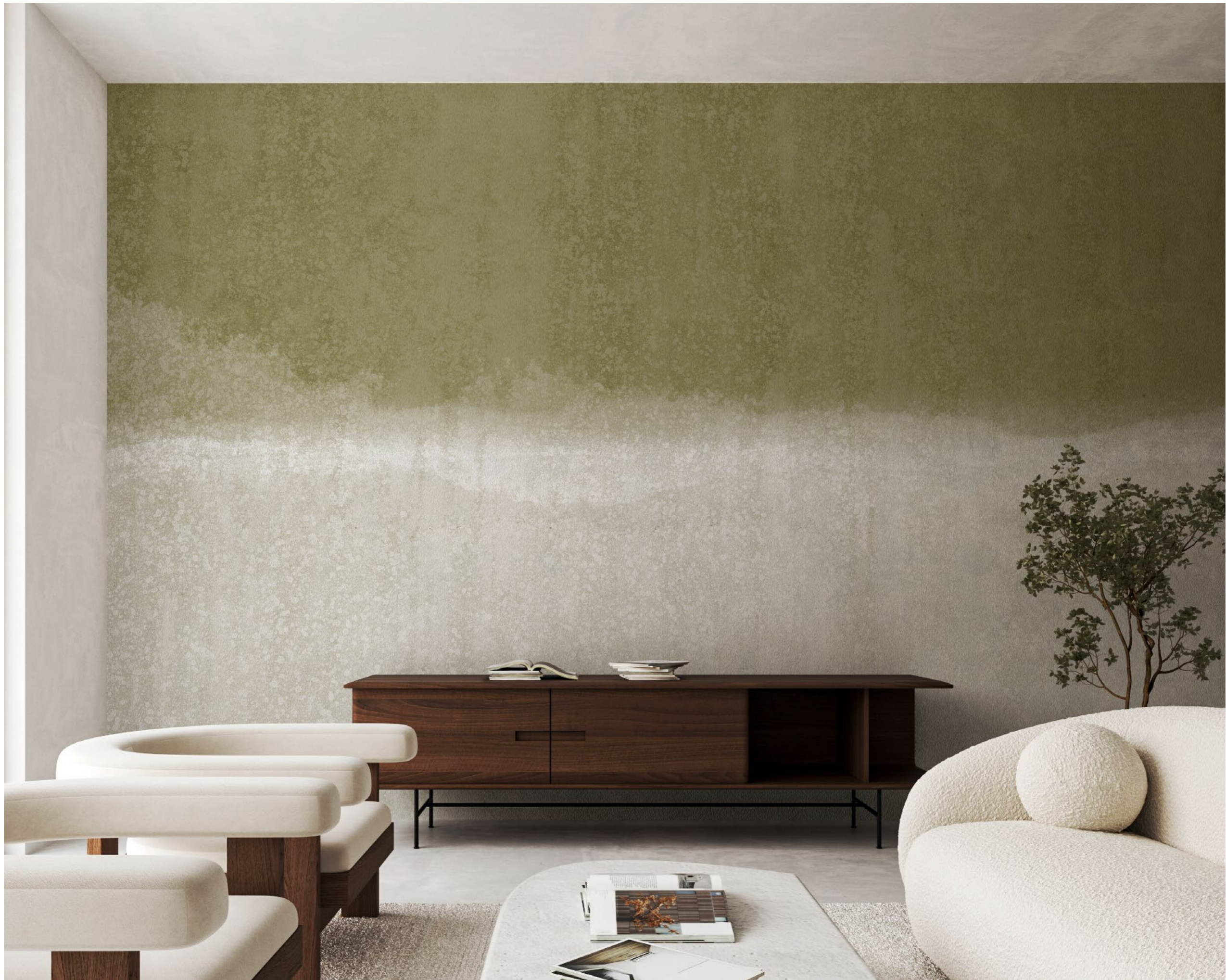
landscapes | FN0401