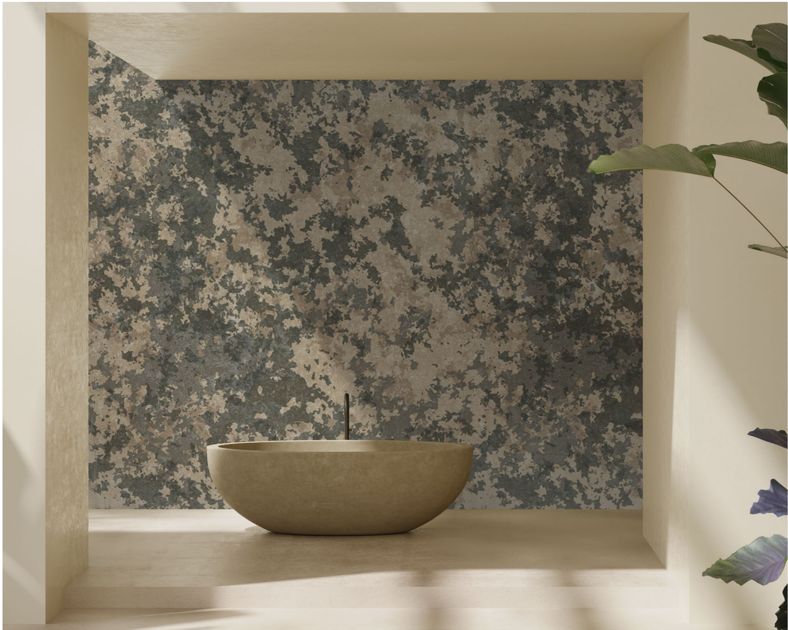
camouflage | FN0102