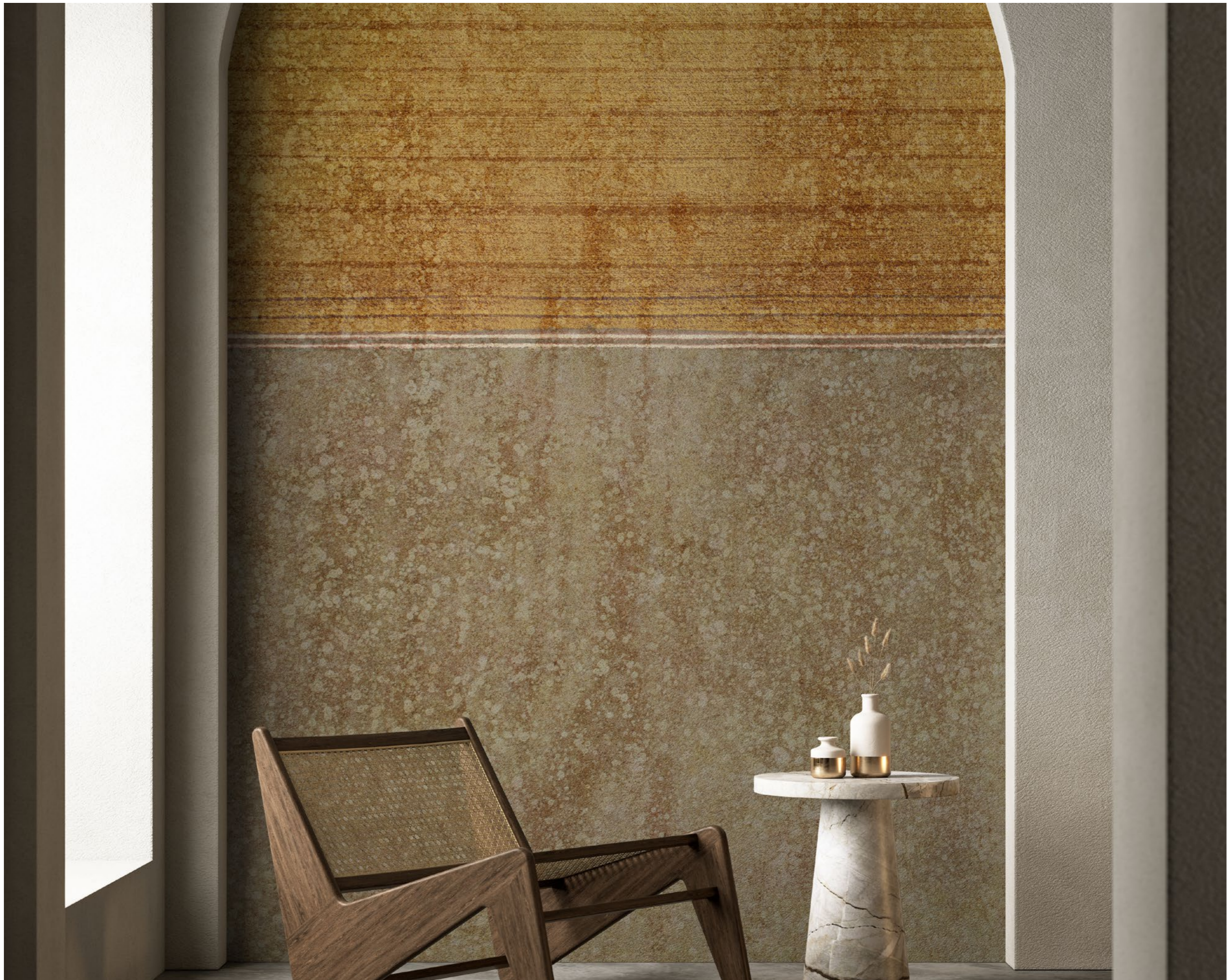
landscapes | FN0503