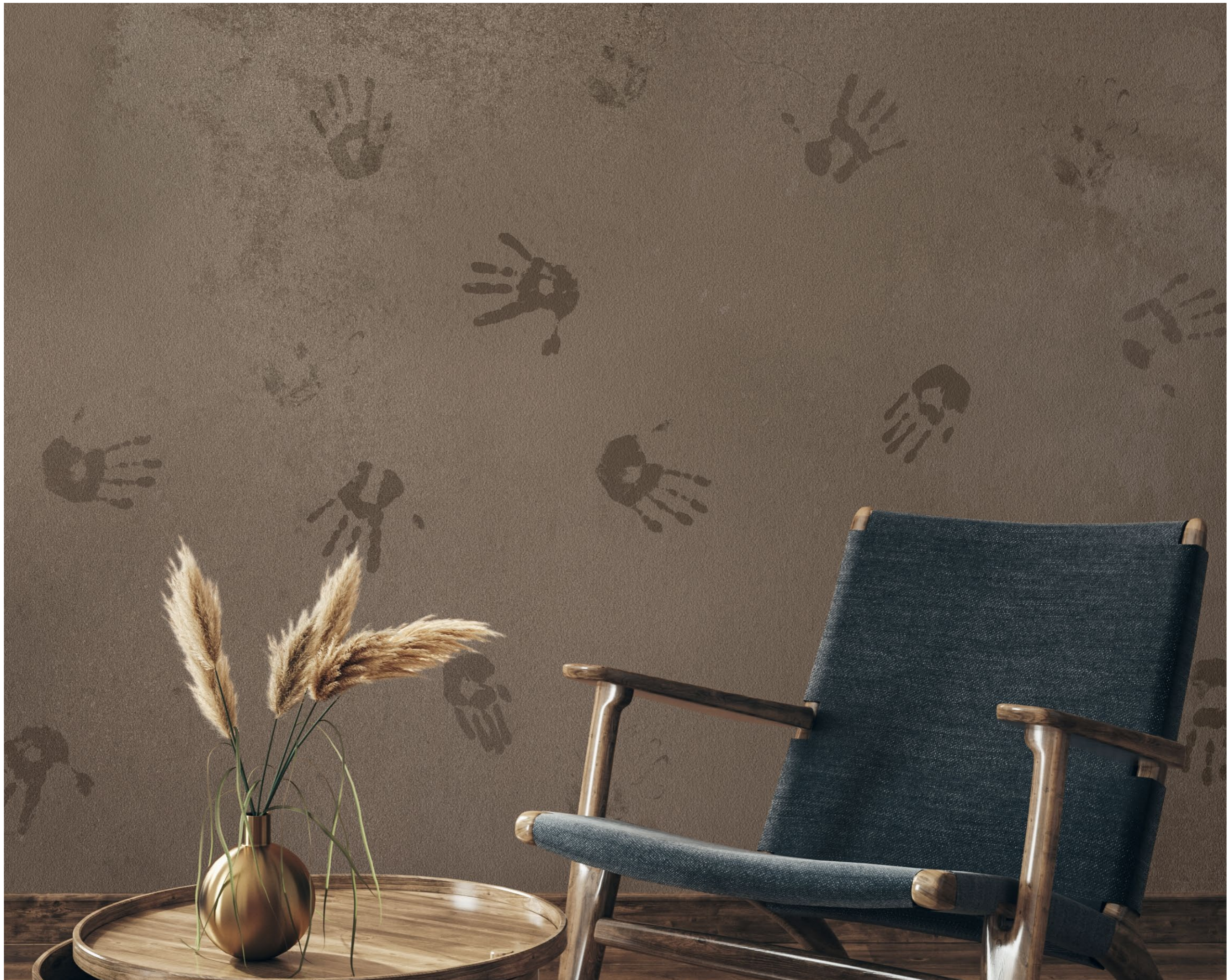
handprints | FN0205