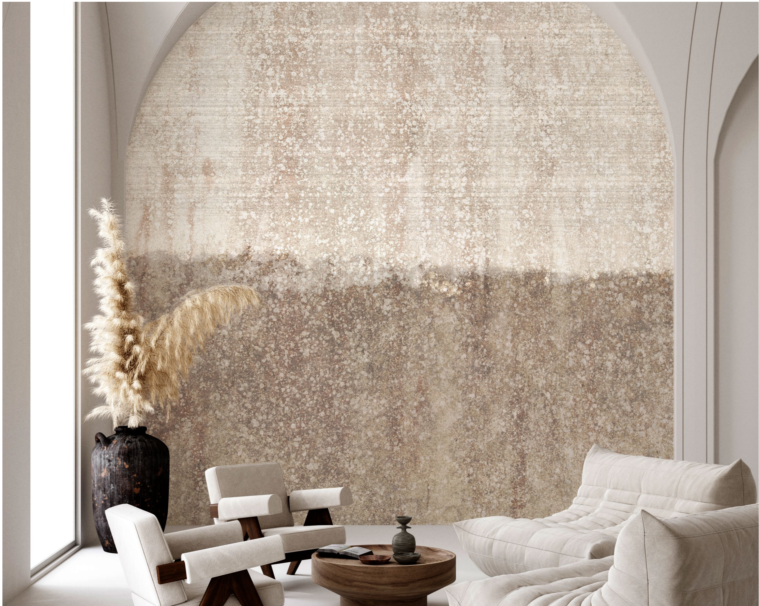
landscapes | FN0304