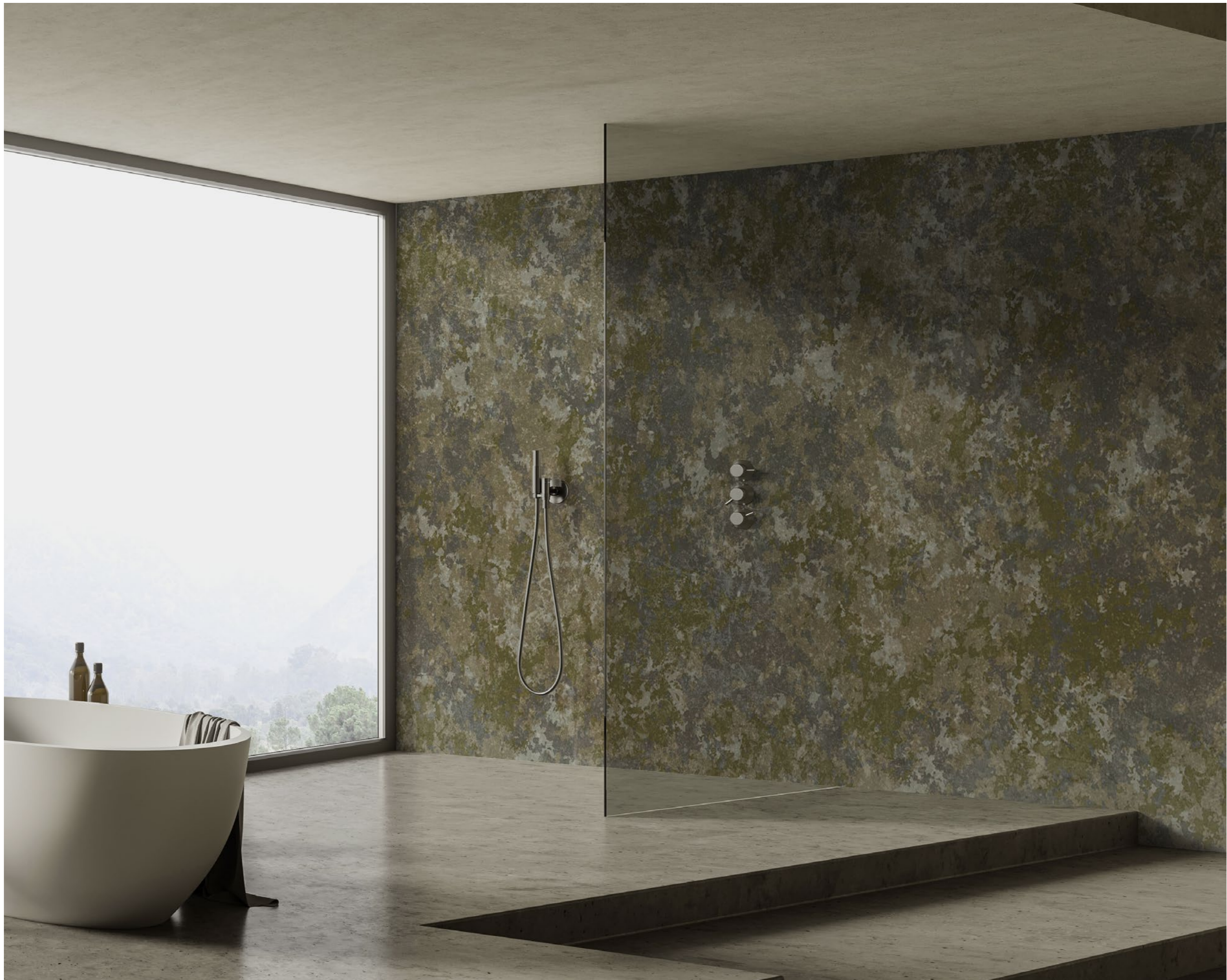
camouflage | FN0104